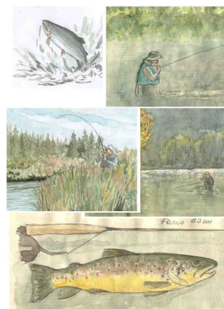
Quarta di Copertina

*. La stampa nel formato 17x24 dà i migliori risultati di stampa. La stampa nel formato A4, essendo più grande, potrà ridurre la qualità finale della stessa.